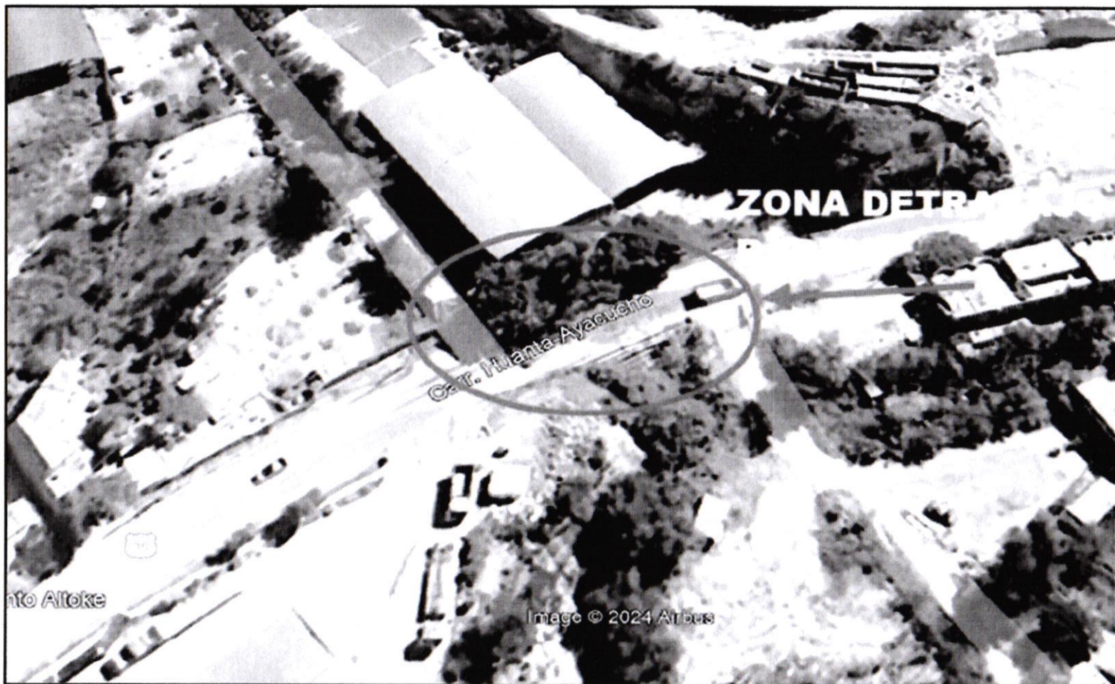
IMAGEN N° 01 ZONA DE INTERVENCION CONSTRUCCION DE BADEN DE 42 ML.

Dirección: Mza M1 Lote 7 BQ Los Olivos – San Juan Bautista – Huamanga - Ayacucho Celular: 956312687 Email: qaerencia37@gmail.com